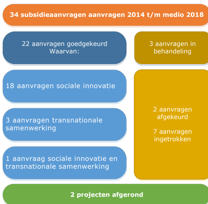
Figuur 2 Status projectaanvragen SITS (medio 2018)

De toegekende projecten hadden gezamenlijk een waarde van 3,6 miljoen euro. Het merendeel van de aanvragen was voor het maximale budget van 190.000 euro (Tabel 3.1).